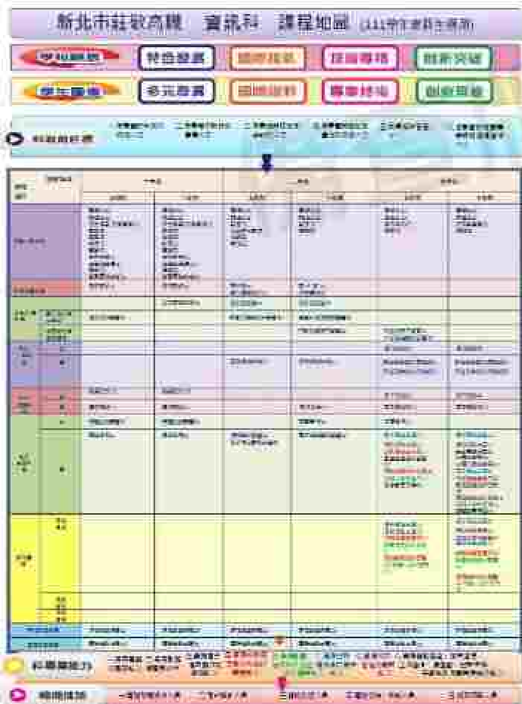
(二) 資訊處理科(資訊科)