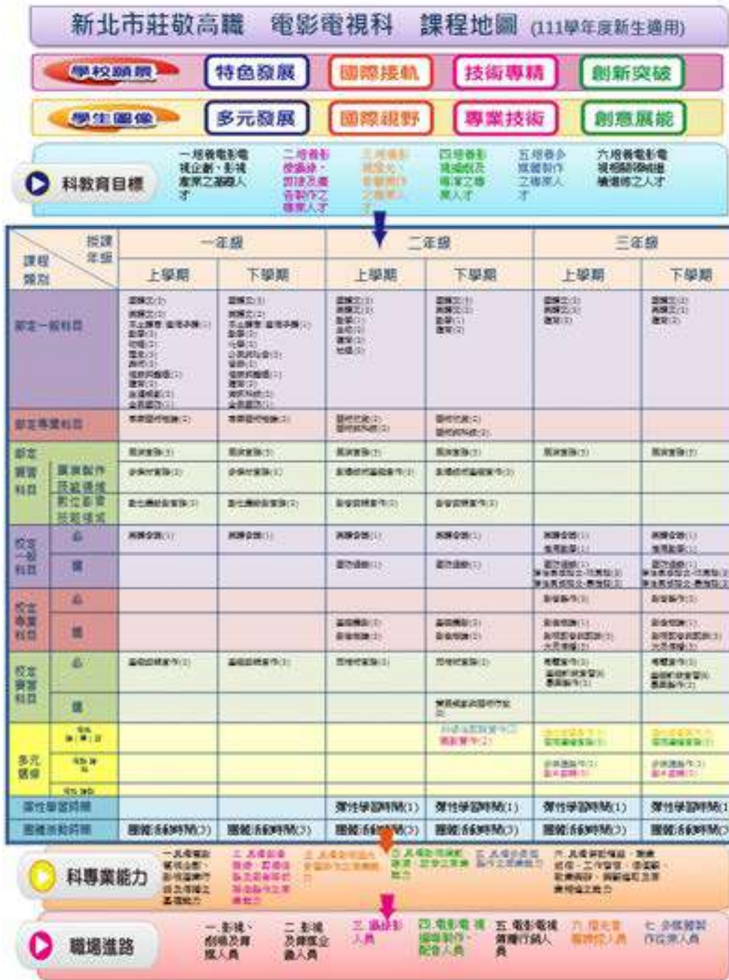
(一十一) 表演藝術科(&8170)